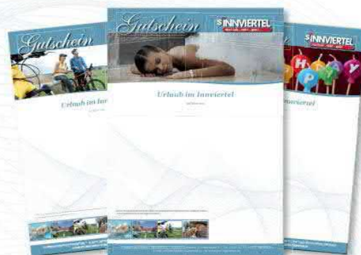
DER GUTSCHEIN ZUM AUSDRUCKEN