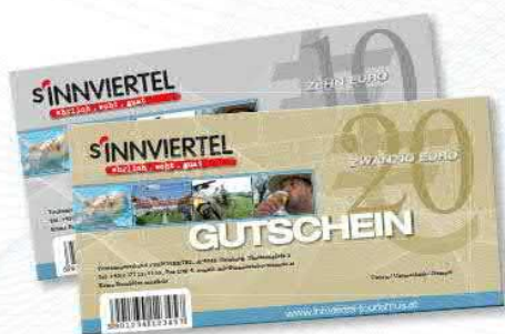
DER KLASSISCHE GUTSCHEIN

Der Innviertel Gutschein ist je nach Lust und Laune als klassischer Wertgutschein oder als flexibler Wohlfühlgutschein zum Ausdrucken daheim erhältlich.