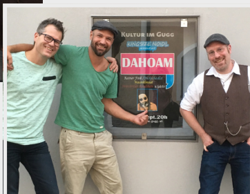
Dickschädlat zu dritt