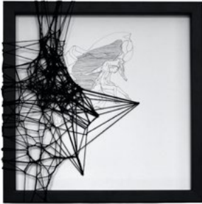
Birgit Schweiger „TMTTOS“