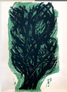
Günther Schafellner - „Natur IV“